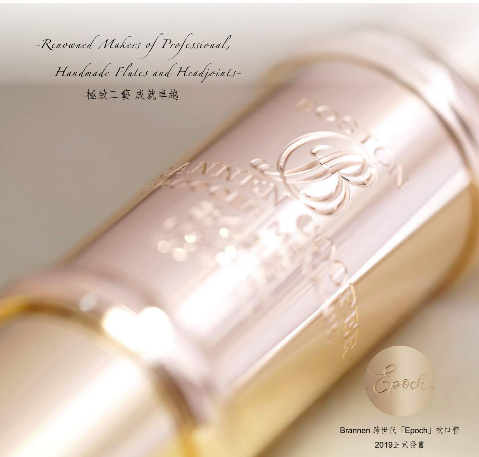
Brannen 跨世代「Epoch」吹口管 2019正式發售

-Renowned Makers of Professional, Handmade Flutes and Headjoints- 極致工藝 成就卓越